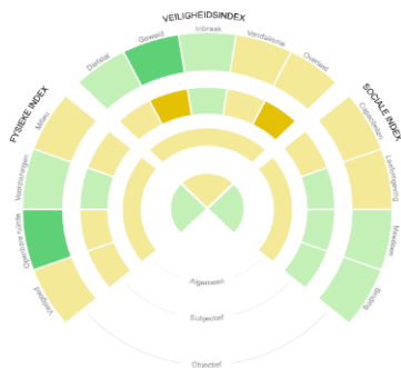
Wijkprofiel Oude Noorden 2016