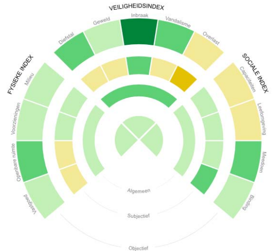
Wijkprofiel Oude Noorden 2018